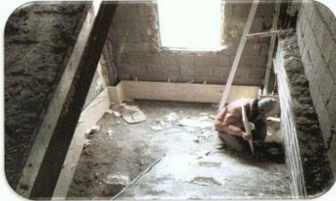
یک رگه کردن طبقه 19