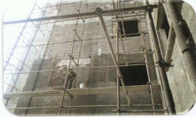
استر دیوار آسانسور