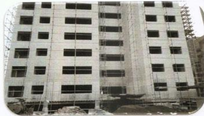
نمای شسته ضلع غربی