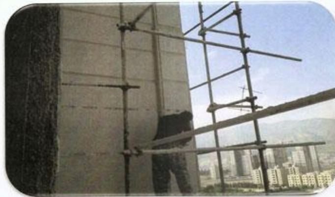
بند کتشی نمای شمال شرقی