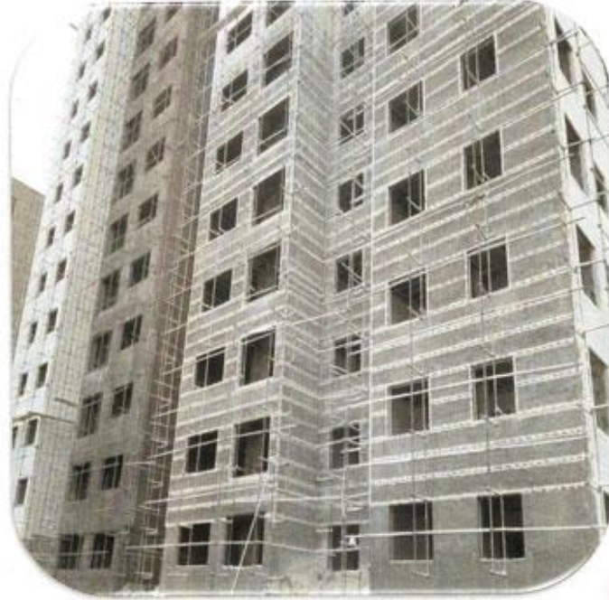
شیشه گذاری نمای شمال غربی