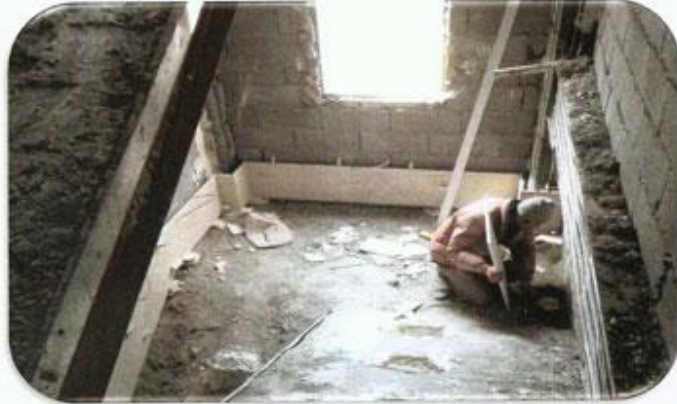
یک رگه کردن طبقه 19