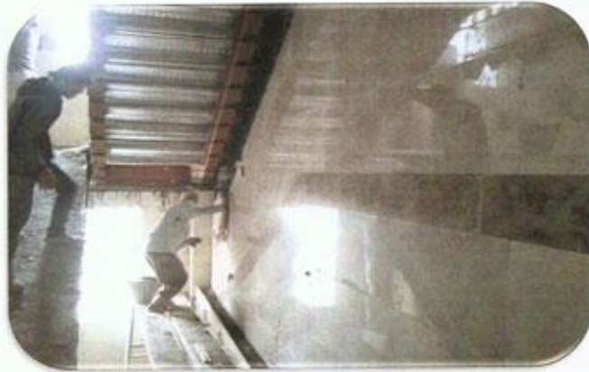
سنگ کاری راه پله شرقی طبقه 17