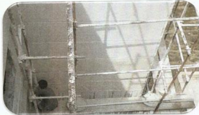
نمای شسته هتلع شمال شرقی