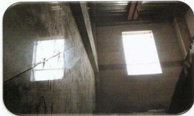
سنگ کاری راه پله طبقه 14