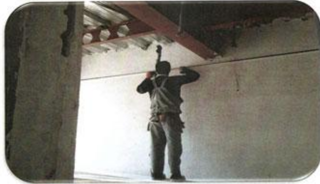
زیر سازی سقف کاذب طبقه 14 واحد C