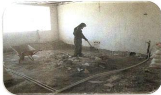
نظافت واحد ها