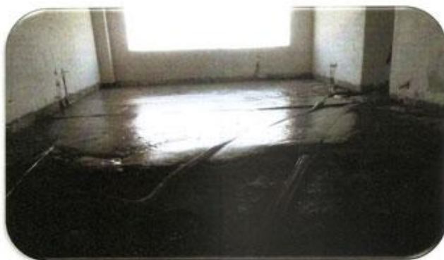
اجرای قوم بتن