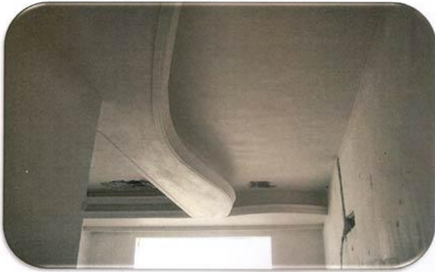
سفید کاری سقف اتاق خواب واحد شرقی طبقه ۲۱