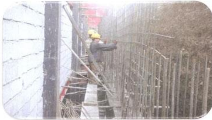
بالتن میلگرد دیوار ضلع شمال بستن قالب های دیوار ضلع شمال طبقه ۲-