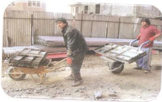
انتقال قالب به گودیاس