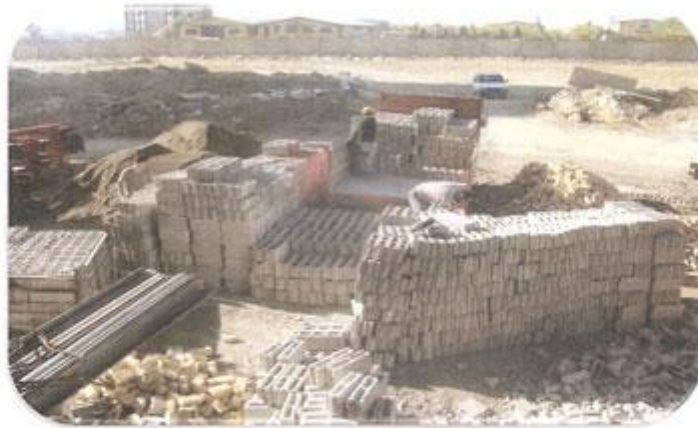
تخلیه و حمل مصالح به طبقات