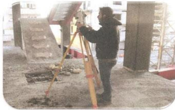
جانمایی محل اجرای دیوارهای پیرامونی