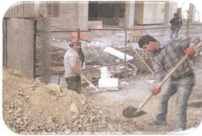
خاکریزی پشت دیوار ضلع جنوب