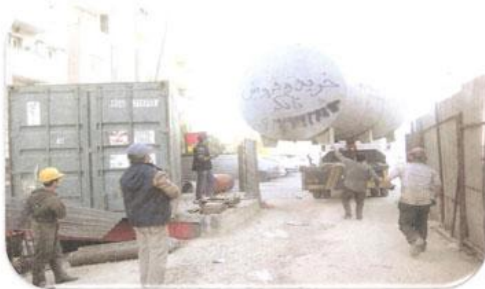
تخلیه تانکر آب