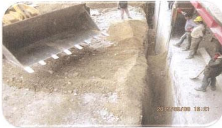
خاکریزی دیوار ضلع غربی