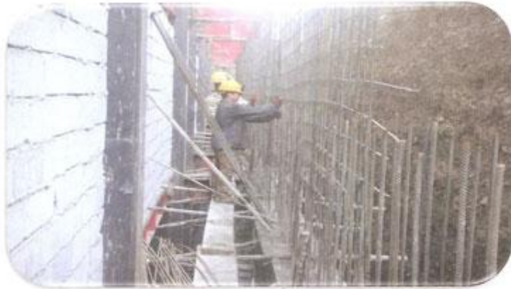
بالتن میلگرد دیوار ضلع شمال بستن قالب های دیوار ضلع شمال طبقه ۲-