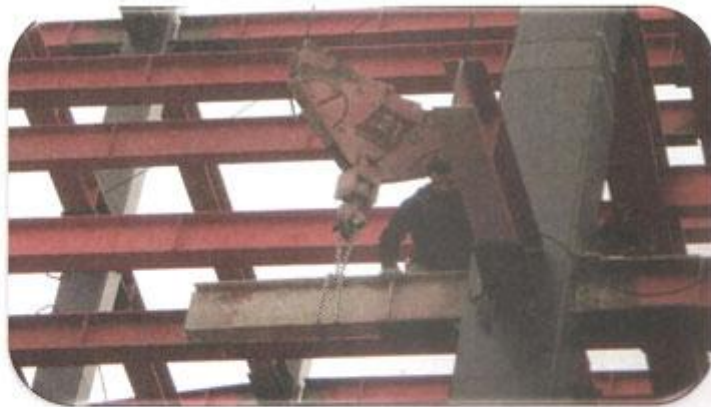
نصب کنسول های ضلع شرق