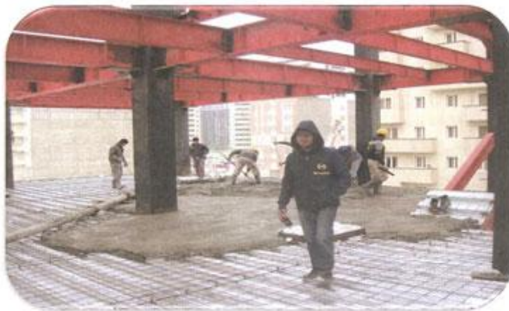
بتن ریزی سقف طبقه سوم بازکردن قالب های ضلع غربی