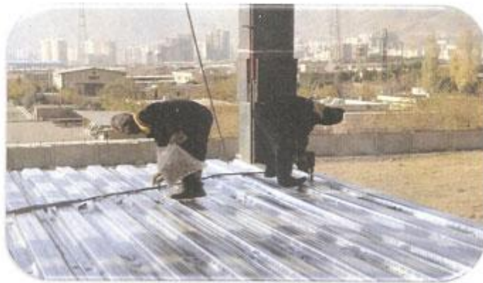
نصب گلمیخ سقف طبقه سوم