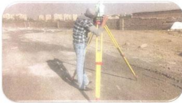
شاقولی نمودن ستون های پارت ۴