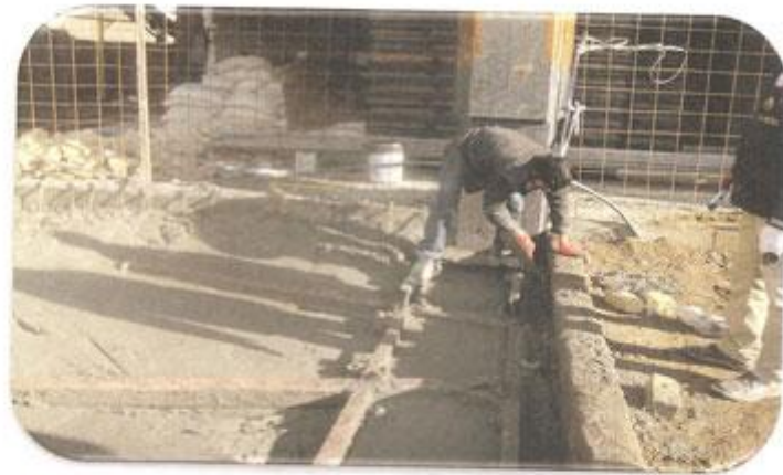
جامبایی پایه تثبیت جرثقیل