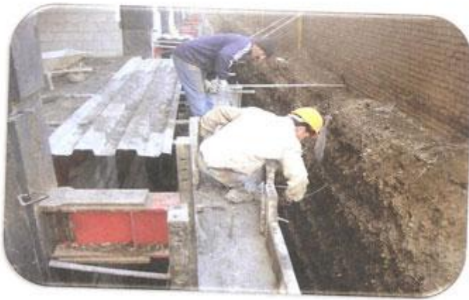
بازکردن قالب های دیوار ضلع شمال