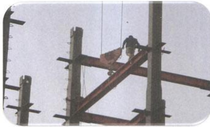
نصب پل های پارت ۴