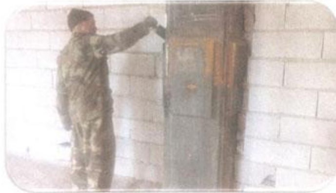
زدن ضدننگ وصله ستونها