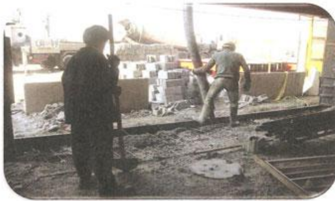
بتن ریزی دیوار ضلع غرب