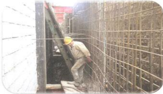
بازکردن و انتقال قالب از طبقه ۲ به ۱-