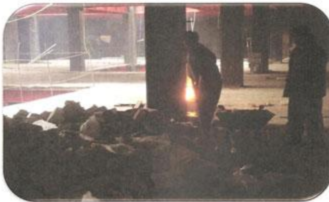
جمع آوری نخاله ها از طبقه ۱-