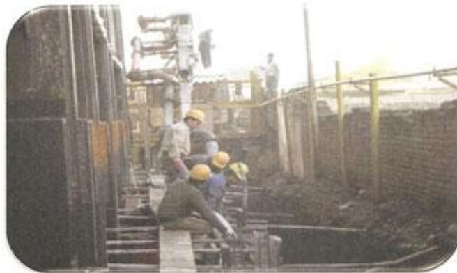
بتن ریزی دیوارضلع شمال طبقه ۱-