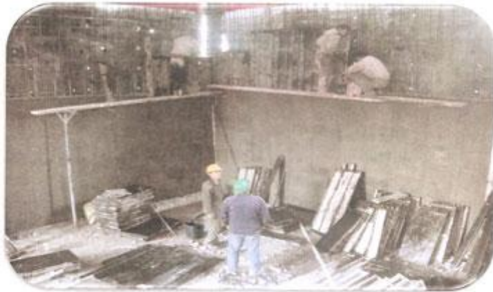
بستن قالب دیوار ضلع غرب طبقه ۱-